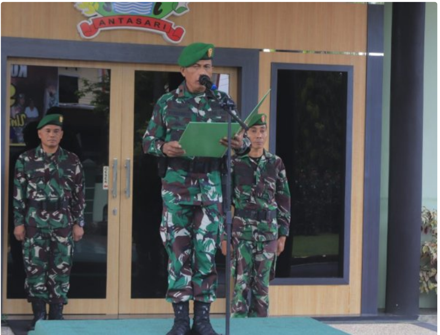
Makna Upacara Bendera Merah Putih Dibulan Suci Ramadhan Bagi Prajurit Kodim 1006/Banjar

MARTAPURA - Bagi Prajurit TNI AD Upacara Pengibaran Bendera Merah